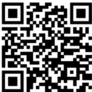
Fig. 1. Acceso directo a la página oficial de la Revista REDCieN

La estructura de la página web de la revista es la siguiente según lo predeterminado por la plataforma Open Journal System, se puede revisar la estructura en la URL: https://redcien.com/index.php/redcien (Fig. 1).